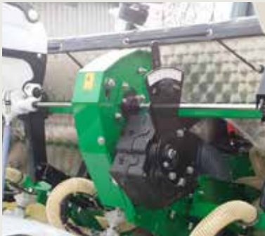
Трансмиссия для микрогранулятора версия Плюс, с трехкамерным вариатором