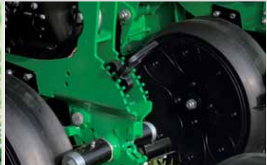
Практичная и быстрая регулировка глубины посева