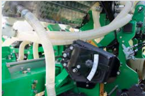
Трансмиссия для механизма удобрения версия Плюс, с трехкамерным вариатором