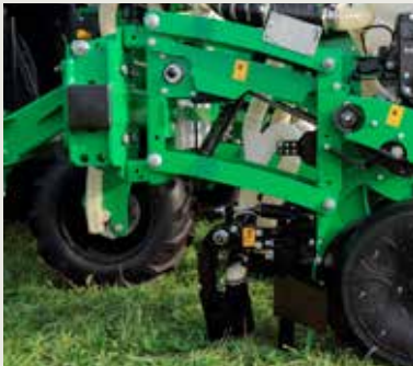
Анкерные сошники для удобрения установлены на высевающих секциях для их постоянной непрерывной и одинаковой дистанции распределения