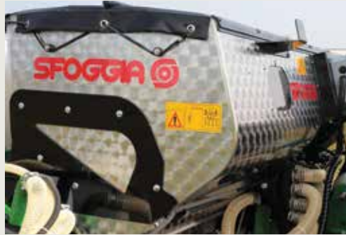
Большой бункер из нержавеющей стали на 900 литров с объемными распределителями Сфоджа