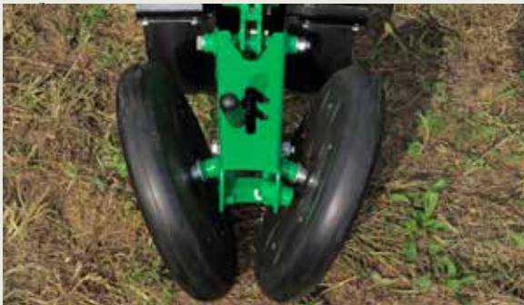
Практичная и быстрая регулировка давления окучивающих колес Колеса 2" x 13"