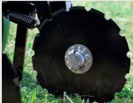
Дисковые сошники для удобрения установлены на высевающих секциях для их постоянной непрерывной и одинаковой дистанции распределения удобрения.