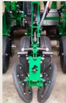
Окучивающие колеса 1" x 13"