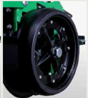
Колеса для глубины посева резиновые широкие 400x115 со спицами "лучевые" для влажной почвы