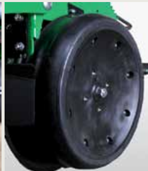
Колеса для глубины посева резиновые широкие 400x115 Доступна также версия узких колес 400x60