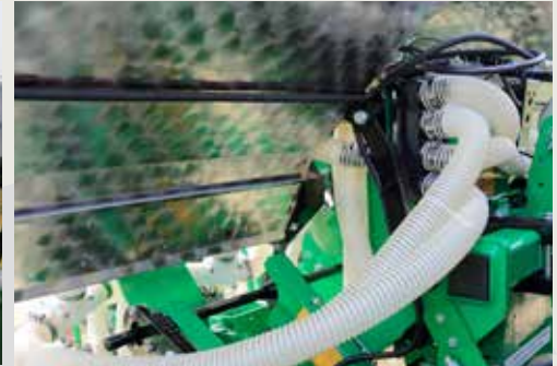
Пневматическая тяга для удобрений