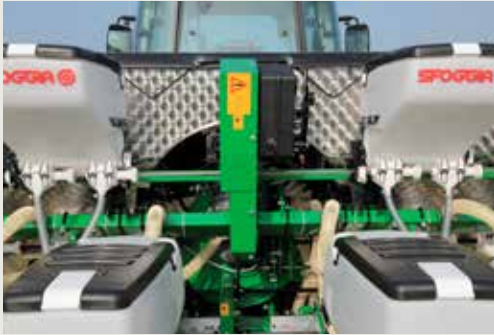
Микрогранулятор с пластиковым бункером на 32 литра с двумя выходами и на 18 литров с одним выходом с объемными распределителями Сфоджа